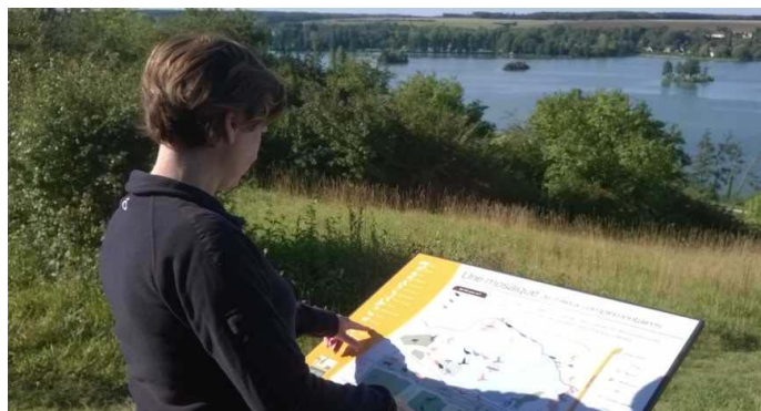
Le sentier du Coteau a été aménagé : quatre panneaux d'information et trois points de vue sur l'étang.