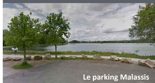
Le parking Malassis