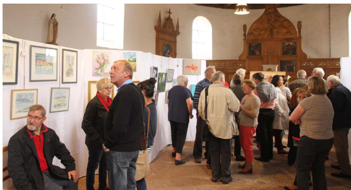
L'église d'Écluzelles a accueilli l'exposition des artistes de l'association Dreux Arts Loisirs.